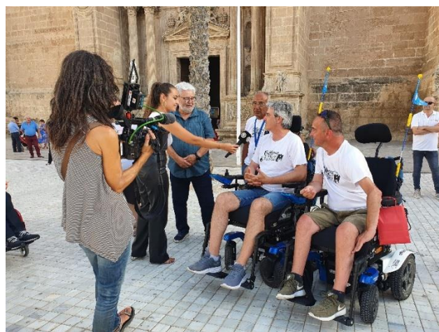
Entrevistados en televisión de Almería antes de la salida en la plaza de la Catedral.

El 20 de mayo presentamos en redes sociales el proyecto anual por etapas que venimos realizando desde el año 2019, que llevaba por nombre, CaMinus Mozárabe de Santiago.