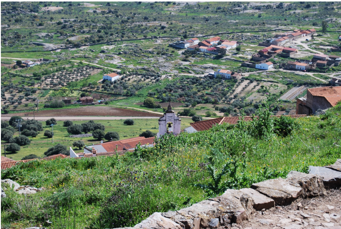
Vistas de los huertos de Magacela desde el Castillo.