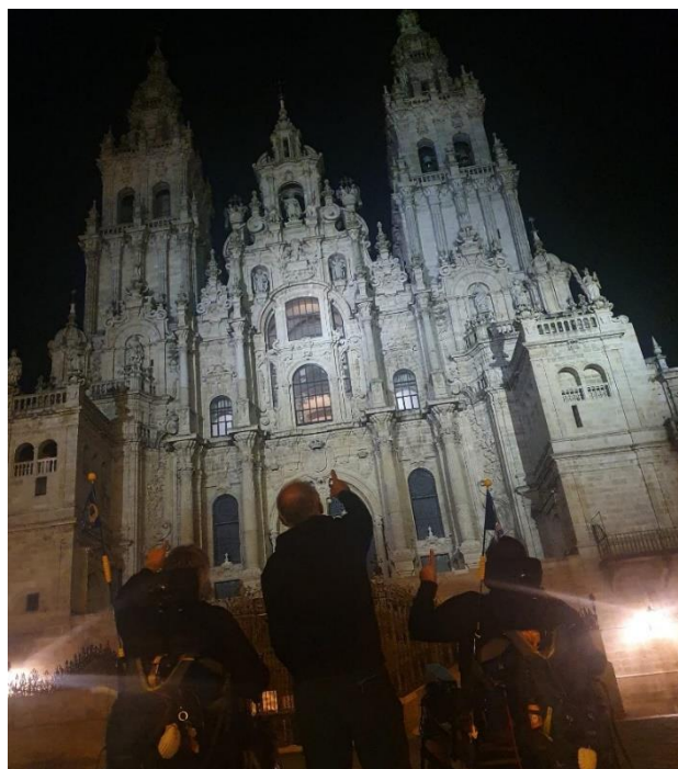
Imagen de la Catedral de Santiago de Compostela después de nuestra llegada

Aunque hemos sido testigos directos de que aún queda mucho por hacer, nos consta que la asociación Jacobea de Badajoz, y la asociación ADISCAM tienen gran interés por mejorar